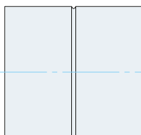
Тип 2. Муфта