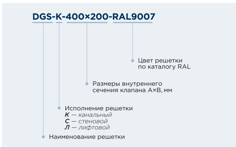
Схема конструкции декоративной решетки

простота конструкции. Стандартный цвет — белый RAL9016. По желанию заказчика возможна окраска в любой цвет по каталогу RAL. Решетка крепится к стене видимым болтовым соединением.