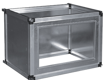
Секция SB (подмес сбоку)