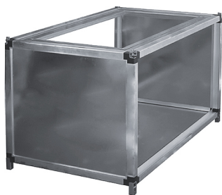
Секция SV1 (подмес сверху)