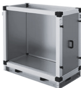
Секция забора воздуха сверху (выхлопа вверх)